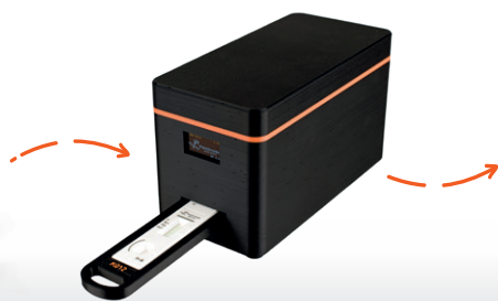
inserimento test nel lettore portatile