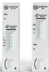
3 gocce di latte